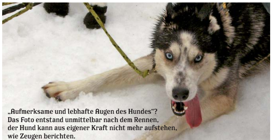
„Aufmerksame und lebhaftige Augen des Hundes“? Das Foto entstand unmittelbar nach dem Rennen, der Hund kann aus eigener Kraft nicht mehr aufstehen, wie Zeugen berichten.