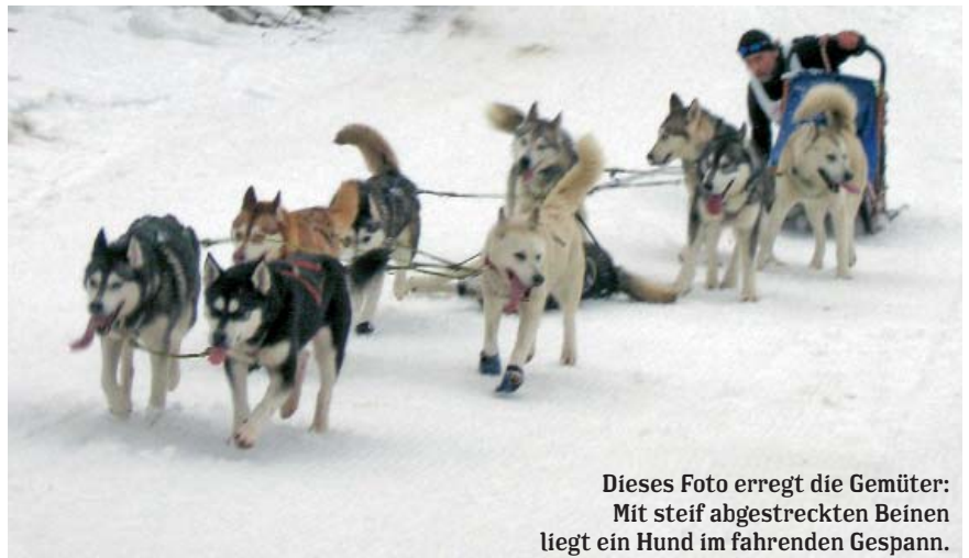
Dieses Foto erregt die Gemüter: Mit steif abgestreckten Beinen liegt ein Hund im fahrenden Gespann.

Dass Maßnahmen getroffen werden, damit sich ein solcher Vorfall wie in Annaberg nicht mehr wiederholen kann und damit die Schönheit des gemeinsamen Sportes von Mensch und Hund in der Natur wieder den Stellenwert bekommt, der ihm zusteht, das ist die vorherrschende Meinung der folgenden Leserreaktionen.